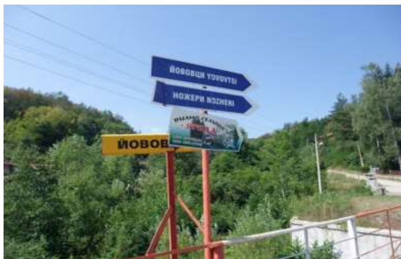
Разклон за Кв. Късовци и кв. Ножерите, гр. Плачковци, община Трявна