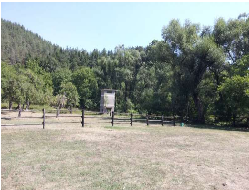
Трансформатор с. Тодорчетата, общ.Габрово