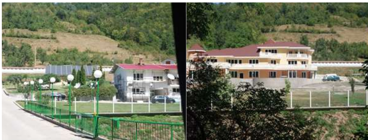
Фотоволтаична централа "Матееви"

Централата се намира извън ПП Българка на самата му граница от северната страна на пътя кв. Етъра - кв. Априлово.