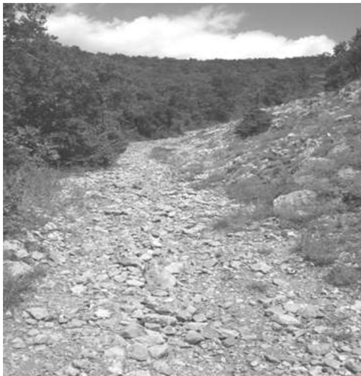
Химитлийски (Ясенски) проход над с. Ясеново. Приблизително така е изглеждал и Шипченския проход в началото на XIX век

който свързва селището с колиби Етъра. Надписът предоставя данни за писмеността от епохата, имена на значими хора в Етъра и традиционни връзки между селищата. Маршрутът маркира развитието на туристическото движение в Габрово, националния туристически събор 1977 г., честванията на 100-годишнината от освобождението на България. Летовището „Тота Венкова“ е създадено благодарение дарението на д-р Тота Венкова- първата жена лекар в България и е изградено през 1944 г.