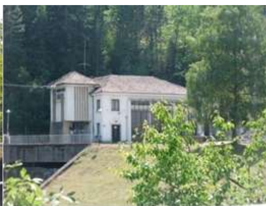
ВЕЦ "Хр. Смирненски"