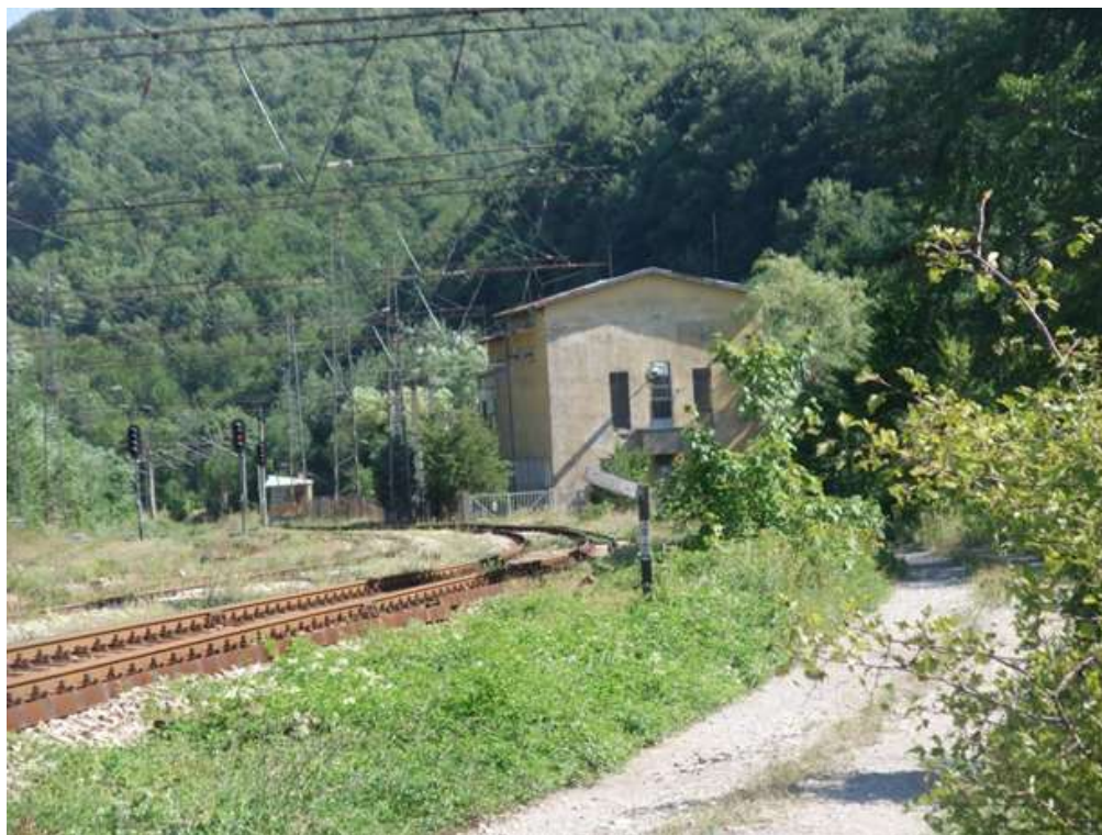
Гарова подстанция Кръстец, община Трявна

В близост до територията на ПП "Българка" се намират следните подстанции: За гр. Габрово - П/С "Синкевица" - 110/10 kV; подстанция "Балкан" - 220/110/20/10 kV.