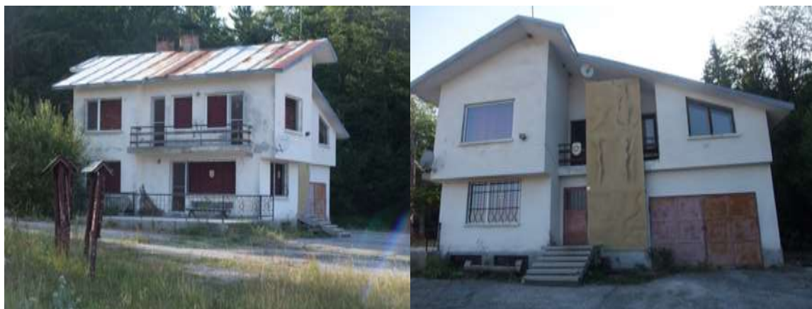
Планинска спасителна служба ( ПСС) Узана

За територията на ПП "Българка" действат 2 екипа от Планинската спасителна служба (ПСС). Това са отрядите на ПСС Габрово и ПСС Трявна, които дават дежурства в почивни и празнични дни, както и при наличие на сигнали за бедстващи туристи подадени в националния дежурен център на ПСС.