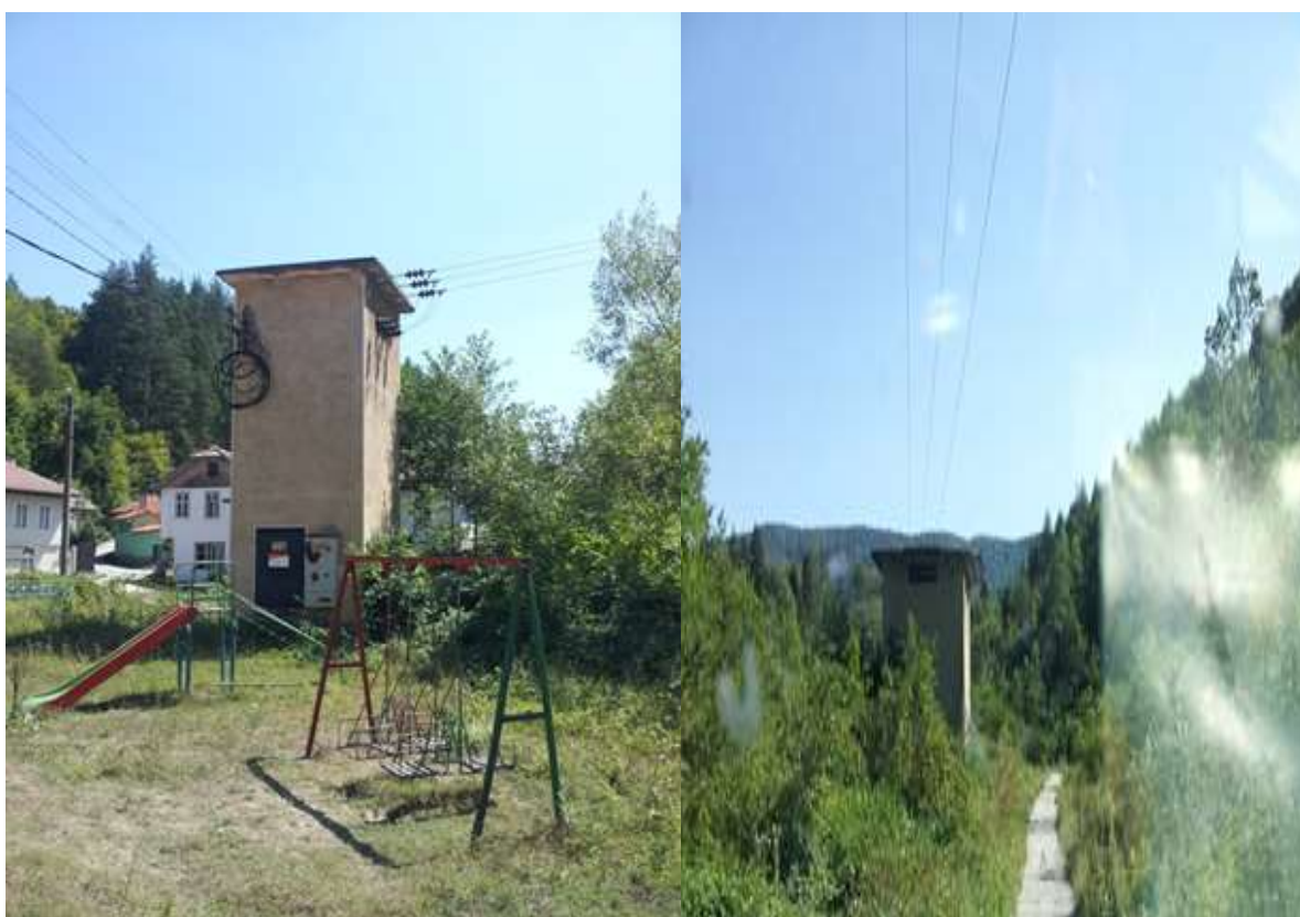
Трансформатор - кв.Нейковци,

Електроснабдяването на Община Габрово се осъществява с кабелни и въздушни линии СрН с номинално напрежение 20 kV, 10 kV и 6 kV. Съоръженията (средно и ниско напрежение) са собственост на "Електроразпределение"- клон Габрово. (Информацията е от ОБЩИНСКИЯ ПЛАН ЗА РАЗВИТИЕ НА ОБЩИНА ГАБРОВО 2005 - 2013г.)