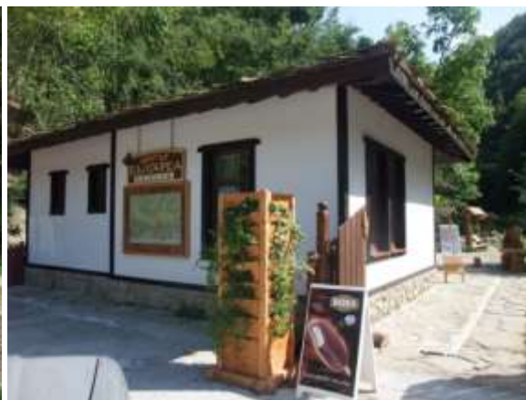
Информационен център "Българка"