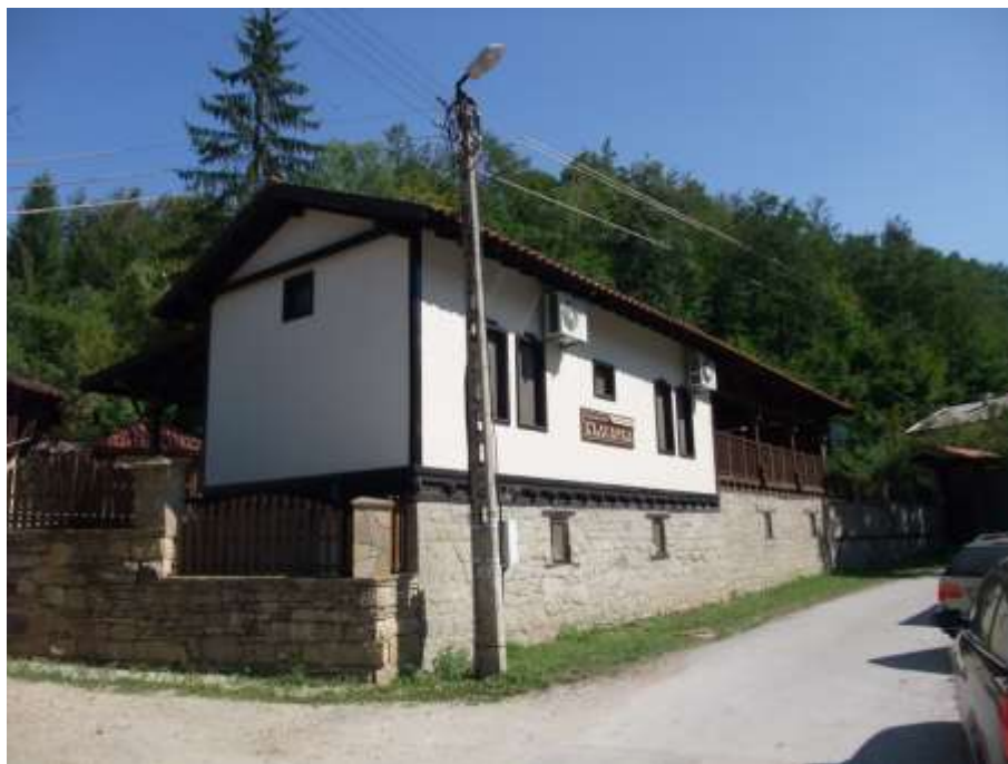
с.Радевци, община Трявна