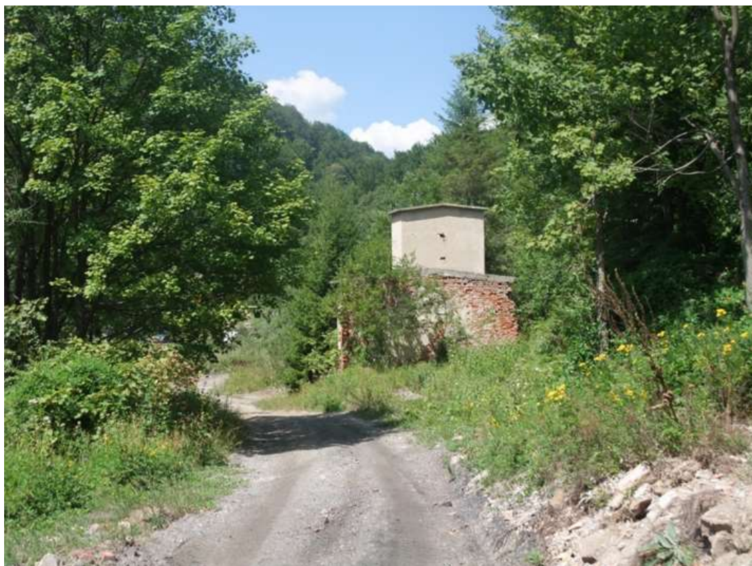
Трансформатор при хижа Извора, общ. Мъглиж

В близост до територията на ПП "Българка" се намират следните подстанции: За гр. Габрово - П/С "Синкевица" - 110/10 kV; подстанция "Балкан" - 220/110/20/10 kV.