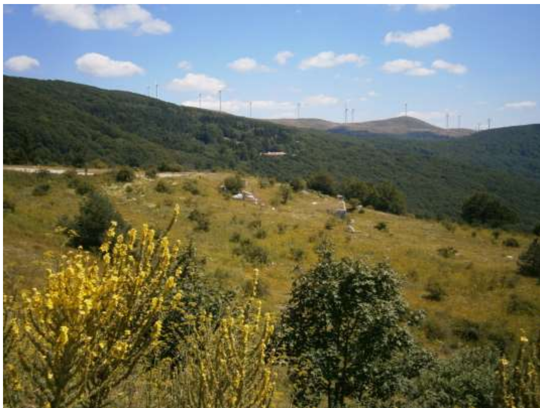
Ветроенергиен парк "Бузлуджа - Ветроком"

В непосредствена близост до границата на ПП "Българка", източно от връх Бузлуджа е изграден Ветроенергиен парк "Бузлуджа - Ветроком". Инвеститор на проекта е швейцарският концерн "Алпик", а изпълнител Ветроком ЕООД.