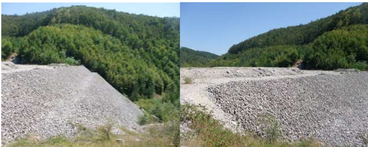
Язовир Нейчовци, кв. Нейчовци, гр. Плачковци, общ. Трявна