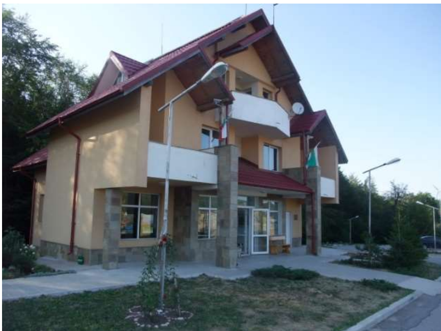
Посетителски информационен център "Узана"

Посетителски информационен център "Узана" - местоположение: местност Узана – тел: 0885/825 224, e-mail: info@uzana-tourism.com ; www.uzana-tourism.com .