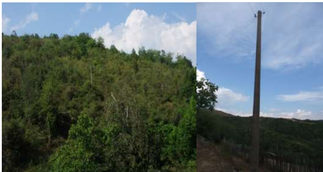
с.Велчовци, община Трявна