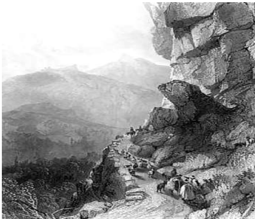
Преминаване през прохода. Гравюра от W. Floyd, 1840 г.

Източник: Старо Габрово и пътищата около него – автор Кирил Койчев